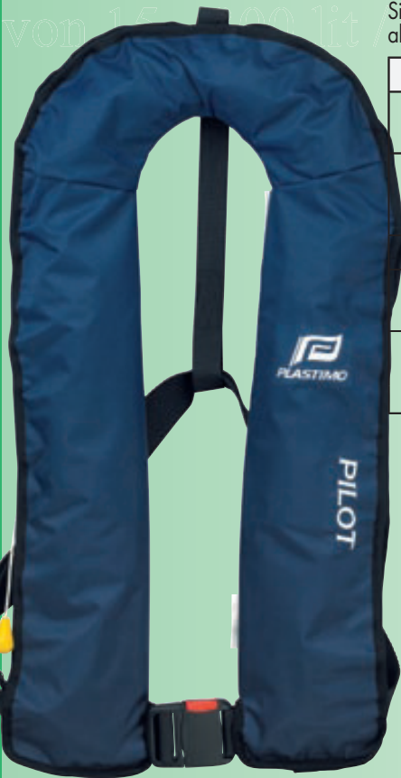
191373 : ohne Lifebelt

Die Rettungsweste Pilot ist insbesondere für den häufigen Gebrauch gedacht (Skipper, Wintertraining, usw.). Sie wurde in Anlehnung an die Optisafe-Rettungsweste (und in Zusammenarbeit mit grossen Weltumseglern) als deren leichtere Variante entwickelt, um so auch den Ansprüchen der Freizeit- und Regattasegler zu entsprechen.