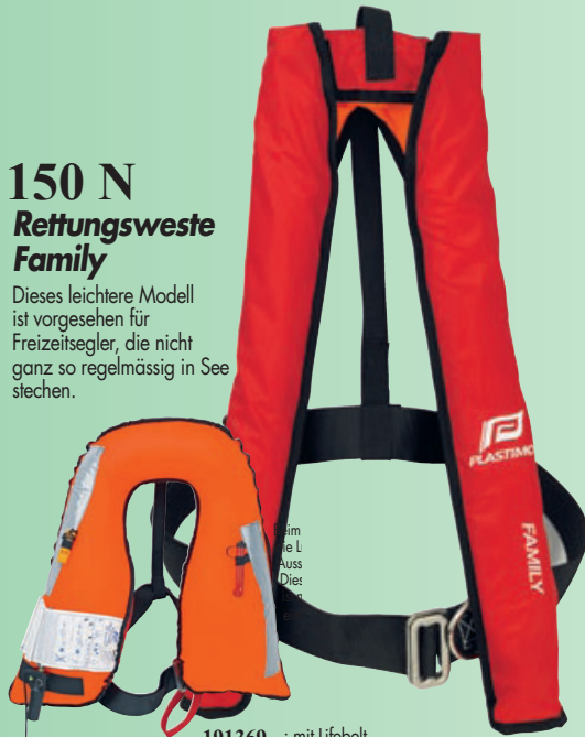
191369 : mit Lifebelt

Dieses leichtere Modell ist vorgesehen für Freizeitsegler, die nicht ganz so regelmässig in See stechen.